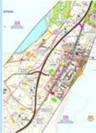
Lageplan OU Klink B 192