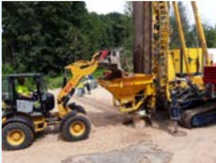
Gründungsarbeiten Ausbau B 321 BAB-Zubringer A14 Schwerin-Ost